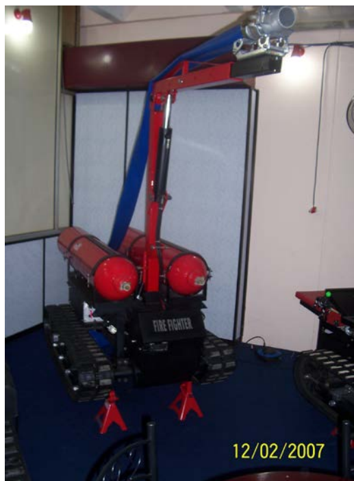
Gambar 1-1 : 'Fire Fighter' .