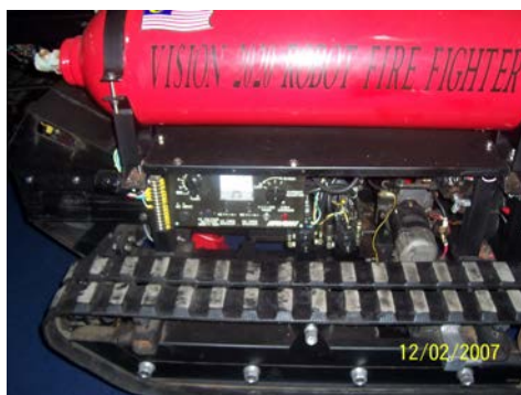
Gambar 2-1 : 'Fire Fighter'