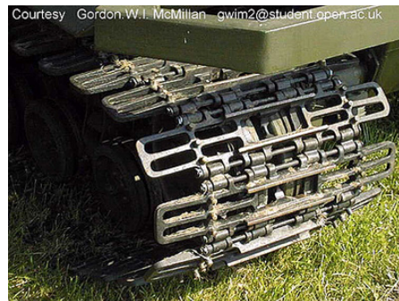
Gambar 2-2 : Contoh ' rubber track ' dan ' steel track '.

Sebagai perbandingan dengan ' steell track '; trak getah lebih ringan, kurang bunyi bising semasa operasi, menghasilkan tekanan yg rendah pada tanah dan tidak merosakkan permukaan.