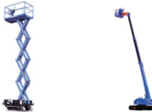
Gambar 1-2 : Kenderaan industri yang berantai.

ini adalah ' scissor lift mechanism ' ataupun mekanisma pengangkat. Mekanisma ini menggunakan sistem berantai untuk bergerak. Jadi apabila menggunakan sistem ini, mekanisma ini dapat melakukan kerja dengan mudah hampir pada semua jenis permukaan.