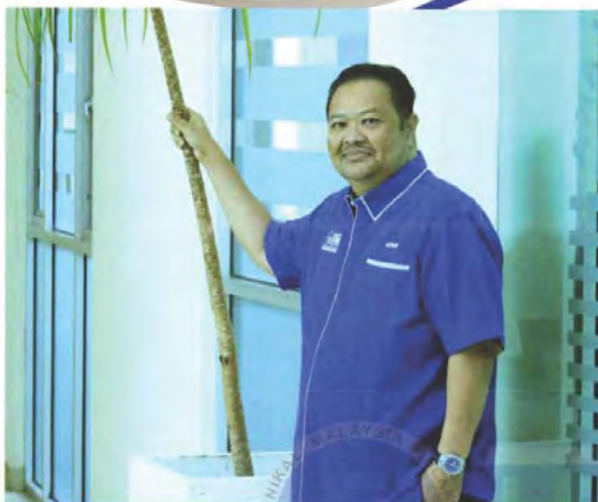
Datuk Azhar bin Mohamed Pegawai Undang-Undang