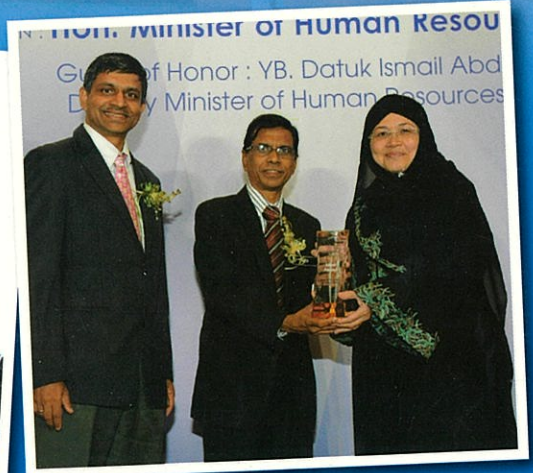
MALAYSIA HR AWARDS 2013: IIUM raih anugerah perak kategori Majikan Pilihan