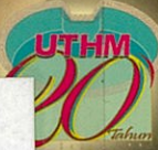
Menteri Pengajian Tinggi lancar logo Sambutan 20 tahun UTHM