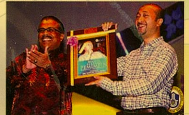
Majlis Bersama Pemimpin Datuk Mukhriz Tun Dr. Mahathir