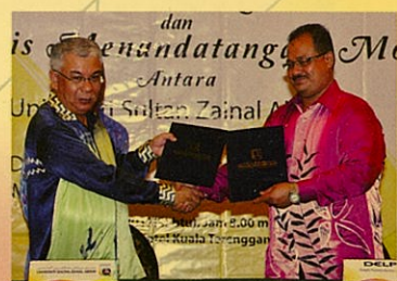
UnISZA rai rakan industri