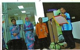
Hari Terbuka Pejabat Pendaftar UTHM