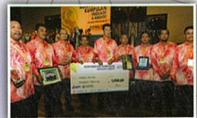
Konvensyen Kumpulan Inovatif Dan Kreatif Peringkat IPTA kali ke-8