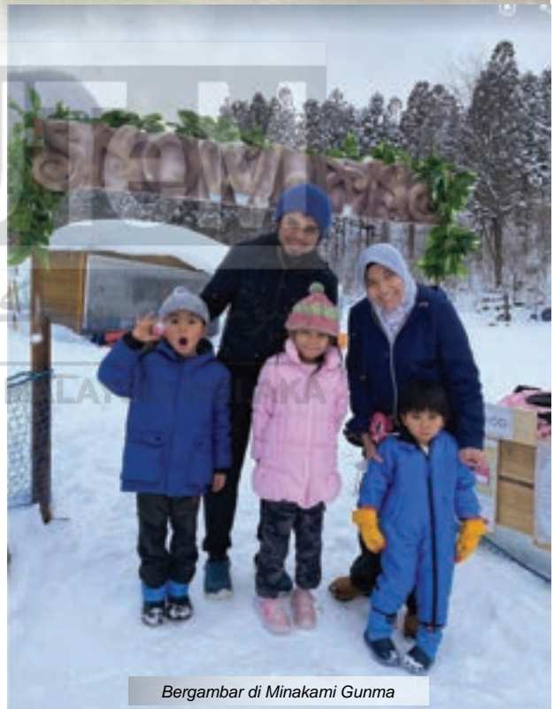
Bergambar di Minakami Gunma

Sejak tahun 2018, saya telah mendapat maklumat bahawa giliran cuti belajar saya akan jatuh pada tahun 2020. Semenjak itu, saya menyusun strategi untuk mendapatkan peluang terbaik kerana pembelajaran kali ini adalah pembelajaran terakhir saya secara formal. Saya mengimpikan untuk menyambung pelajaran di peringkat PhD di luar negara kerana ingin memberi pengalaman baru kepada suami dan anak-anak. Walau bagaimanapun, saya perlu berpijak di bumi nyata kerana untuk penajaan di luar negara, hanya QS Top 100 University di dalam dunia sahaja yang dibenarkan oleh Kementerian Pengajian Tinggi (KPT).