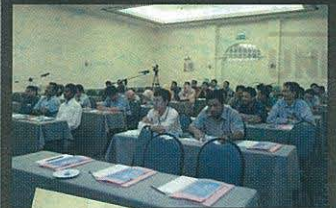
Peserta di kalangan tenaga akademik dari Pensyarah, Jurutera Pengajar dan Tutor Fakulti Kejuruteraan Mekanikal dan Fakulti Kejuruteraan Pembuatan sedang mendengar ceramah.