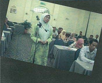
Seorang Pensyarah sedang mengajukan soalan berkenaan sesi penerangan.

Sesi Penerangan ini akhirnya dapat memberikan kefahaman kepada seluruh warga akademik berkenaan peningkatan kualiti P&P yang akan dilaksanakan oleh Pusat Pengajaran & Pembelajaran