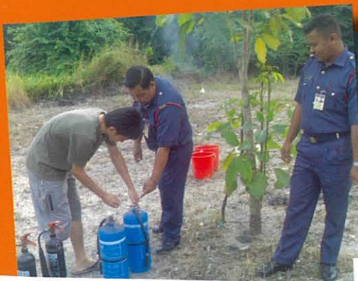
Cara memegang pemadam api