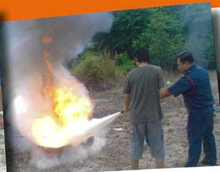
Cara memadam api dengan cepat