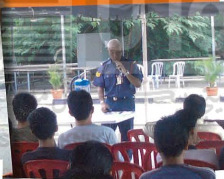
Ceramah Pemadam Api