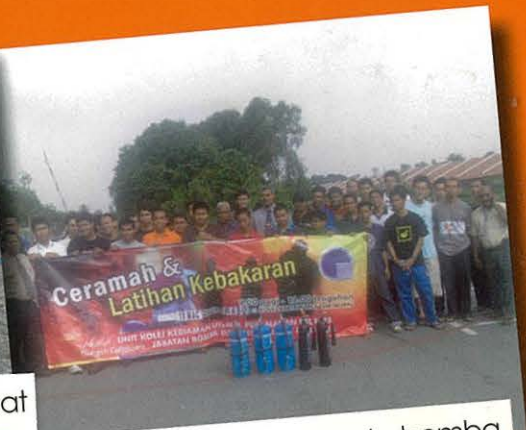
Gambar bersama anggota bomba