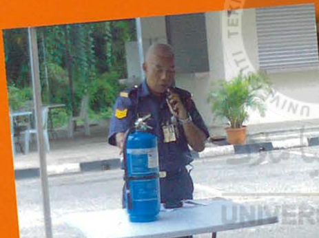
Penerangan Pemadam Api

Matlamat program ialah mendidik Mahasiswa agar mempunyai kesedaran tentang beberapa aspek pengetahuan yang berguna mengenai bahaya api dan mendedahkan tindakan perlu bagi pencegahan awal. Mahasiswa dapat merancang, melaksana serta mengetahui cara-cara memadam api kebakaran serta asas pertolongan cemas. Menimbulkan rasa kasih sayang persefahaman serta tolok ansur sesama sendiri dalam mengawasi keselamatan harta benda dan kehidupan bermasyarakat.