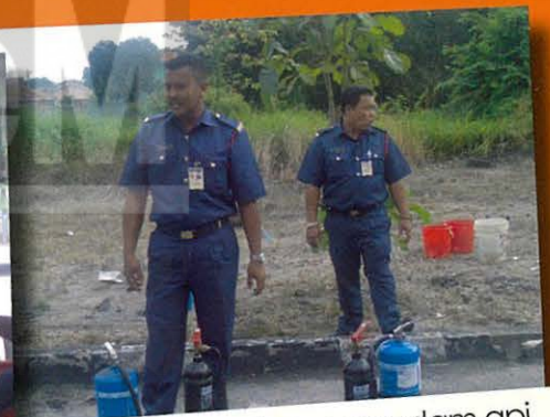
Cara2 menggunakan pemadam api