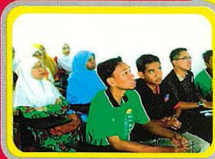
Melihat Tayangan Video Dari Kelab Penyayang UTeM