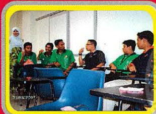
Melawat Bilik Rasmi Kelab Penyayang UTeM