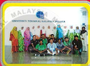
Bergambar Kenangan Di Kampus Industri