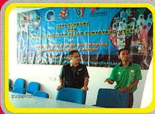
Perbincangan Dua Orang Pengerusi Kelab