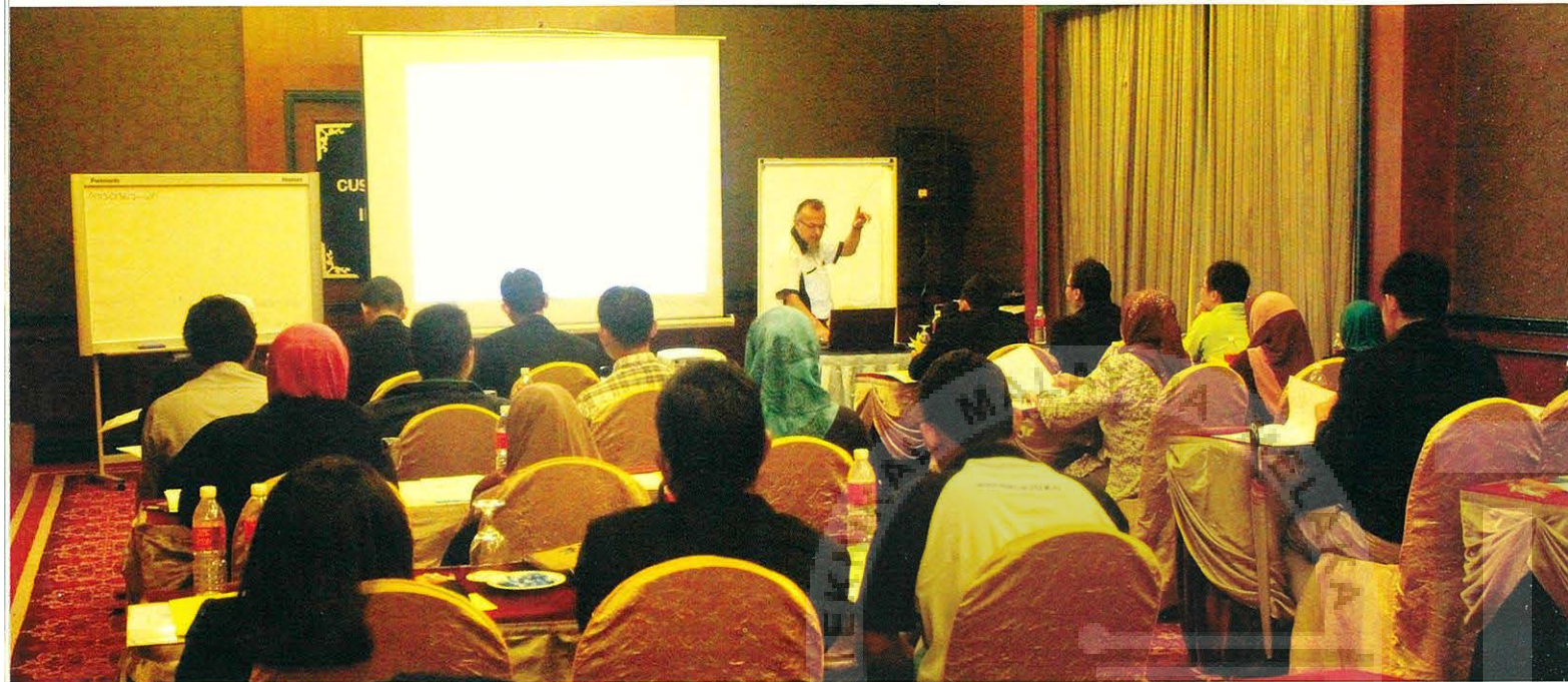
Oleh: Akmal bin Abdul Manap

Pada 22 hingga 26 Ogos 2014, Bahagian Cuti Belajar, Pejabat Pendaftar telah menganjurkan Kursus Kaedah Penyelidikan Siri 2/2014 bertempat di Hotel Lexis Port Dickson. Kursus ini dilaksanakan sebanyak dua (2) kali setahun yang mensasarkan staf Akademik yang akan melanjutkan pengajian ke peringkat Sarjana dan PhD. Kursus ini turut disertai peserta dari Universiti Sultan Zainal Abidin (UniSZA).