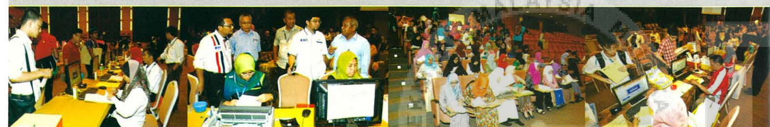
Oleh: Mahathir bin Mazizan