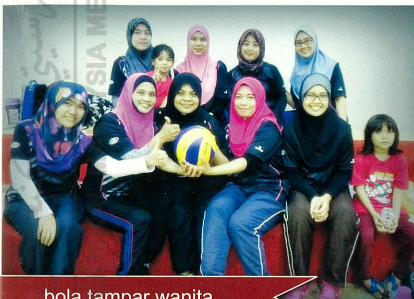
bola tampar wanita