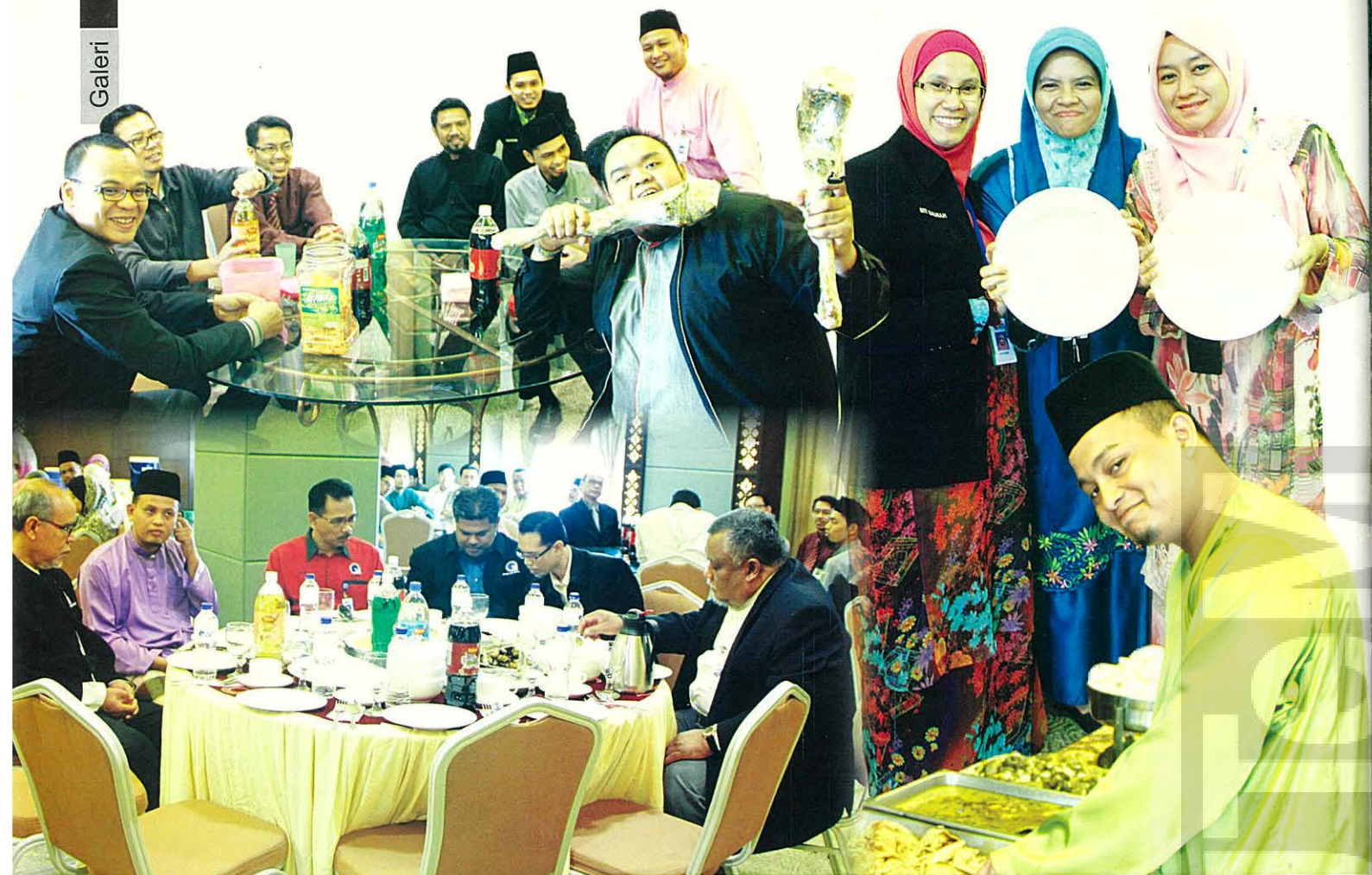
Jamuan Raya Pejabat Pendaftar 2014