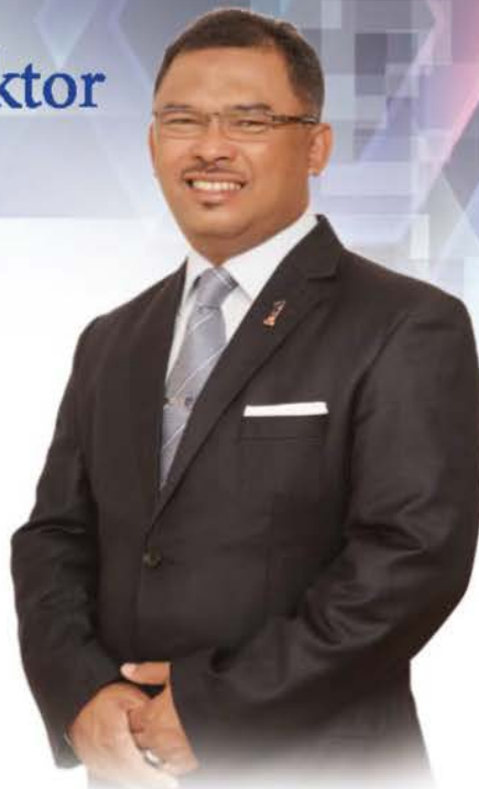
Y.A.B. Datuk Seri Ir. Haji Idris bin Haji Haron Ketua Menteri Melaka

Pada masa yang sama, beliau mula bergerak aktif dalam bidang politik dengan bertapak di Tangga Batu. Sebagai anak muda yang penuh dengan wawasan, setiap khidmat bakti yang diberikan sudah tentu dilaksanakan dengan tidak berbelah bahagi. Justeru itu, tidak hairanlah bakat yang dimiliki beliau dapat dihidu oleh ramai pihak termasuklah Y.A.B. Ketua Menteri Melaka ketika itu iaitu Datuk Seri Mohd Ali bin Rustam yang juga merupakan mentor beliau dalam bidang politik.