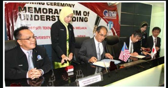
UTeM Tandatangani MoU bersama University of Tokushima Jepun