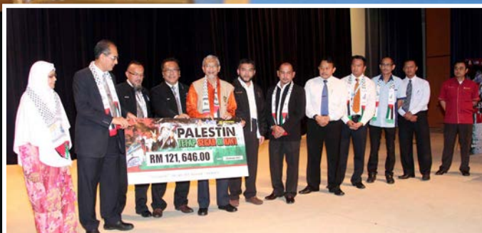
Majlis Palestin Tetap Segar Di Hati