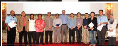
UTeM dan IEEE Berkolaborasi Anjara PERSIDANGAN ANTARABANGSA APAGE 2012