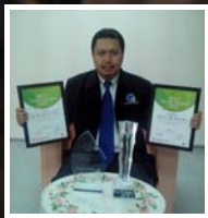
Pensyarah FTK Harumkan Nama Universiti Di Peringkat ASEAN