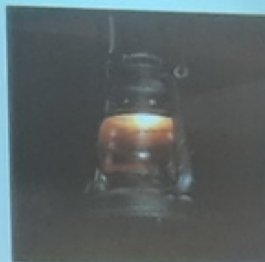
Lampu Minyak Tanah